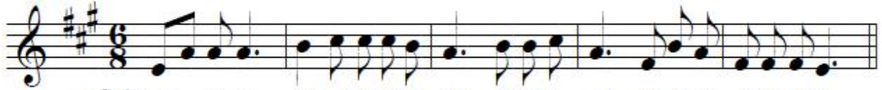
(후렴) 주-님이 당신백성에게 강복하여 평화를 주시리라

화 답 송 : 시편 29(28),1ㄱ과 2,3ㄱ과 4.3ㄴ과 9ㄷ-10(◎ 11ㄴ)