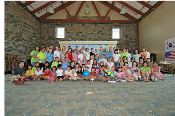
ASIA Summer Camp 2010

Ticket: $20 510) 342-2869, asiasf2012@gmail.com