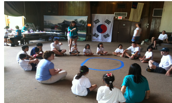
ASIA Summer Camp 2011